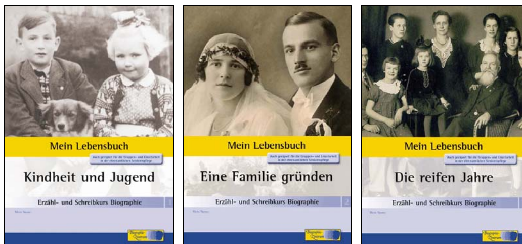
Umschlagabbildungen des dreiteiligen Erzähl- und Schreibkurses Biographie von Andreas Mäckler