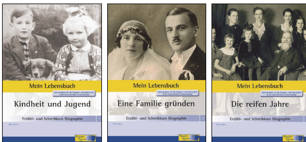
Umschlagabbildungen des dreiteiligen Erzähl- und Schreibkurses Biographie von Andreas Mäckler