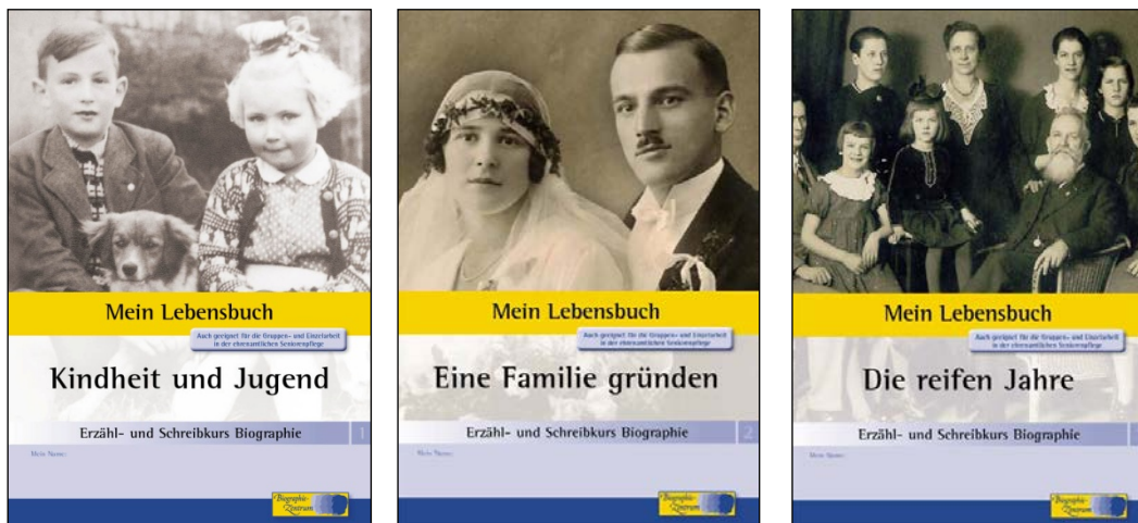
Umschlagabbildungen des dreiteiligen Erzähl- und Schreibkurses Biographie von Andreas Mäckler